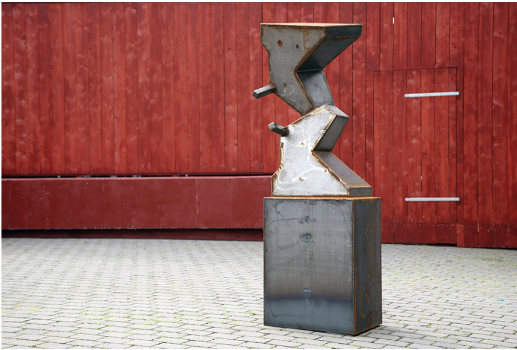
Beeld: Kiss 2015. Atelier Van Lieshout