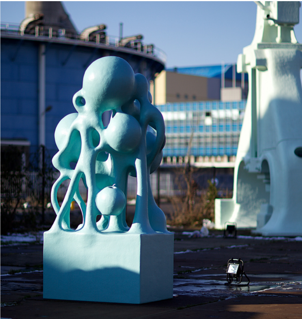
Beeld: AVL Mundo Sculpture Garden. Atelier van Lieshout